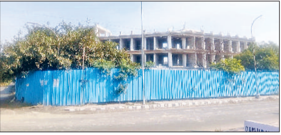
सोनीपत। मुरथल स्थित दीनबंधु छोटू राम विज्ञान एवं प्रौद्योगिकी विश्वविद्यालय में निर्माणाधीन आर्किटेक्चर विभाग का नया भवन।

मुरथल स्थित दीनबंधु छोटू राम विज्ञान एवं प्रौद्योगिकी विश्वविद्यालय में निर्माणाधीन आर्किटेक्चर विभाग के नए भवन का 3 वर्ष में केवल 65 प्रतिशत निर्माण कार्य ही पूरा हो पाया है। ऐसे में नए शैक्षणिक सत्र में आर्किटेक्चर विभाग की कक्षाएं नई इमारत में लग पाना संभव नहीं हो पाएगा। विश्वविद्यालय में आर्किटेक्चर विभाग के नए भवन का निर्माण पूरा करने के लिए पहले जून 2025 तक लक्ष्य रखा था, लेकिन कई कार्य शेष होने के चलते अब उक्त भवन के निर्माण को नवंबर 2026 तक पूरा करने का समय निर्धारित किया गया है। आर्किटेक्चर के नए भवन की खास बात यह रहेगी कि इसे अत्याधुनिक सुविधाओं के साथ भवन को ग्रीन भवन योजना के आधार पर बनाया जा रहा है। इससे भवन में कम बिजली खर्च होने के साथ भूकंप का भी कोई असर नहीं रहेगा।