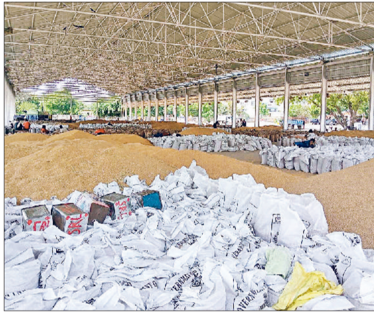
सोनीपत। रोहतक रोड स्थित नई अनाज मंडी में शोध के नीचे पड़ा गेहूं।