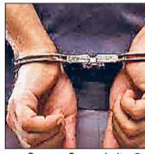
छीनाझपटी मामले में पुलिस नाबालिग सहित चार को गिरफ्तार कर चुकी