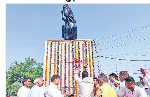
सोनीपत सेक्टर-23 में महाराज सूरजमल की प्रतिमा पर पुष्प अर्पित करते अतिथि व समिति के सदस्य।