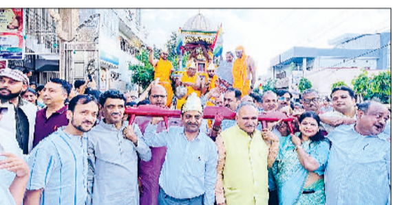
सोनीपत। रथयात्रा में शामिल पूर्व मंत्री साथ में पूर्व मेयर एवं अन्य।